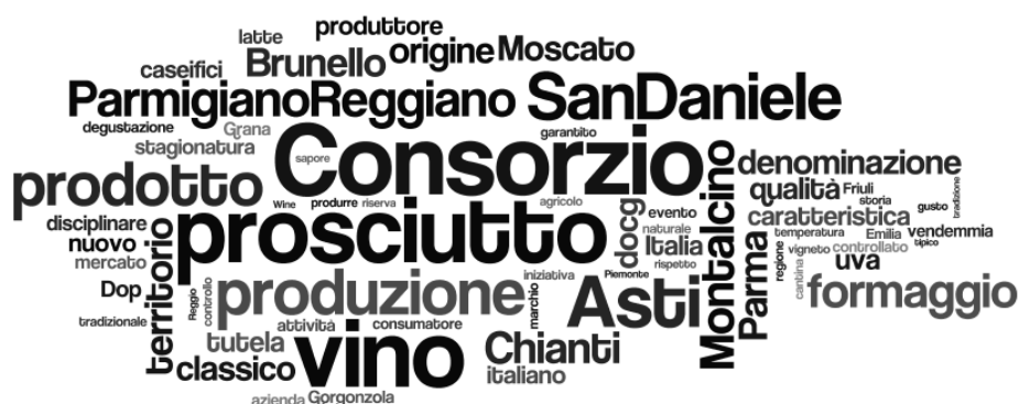
Fig. 1: Unità lessicali prevalenti

I lemmi che presentano un maggior numero di occorrenze sono rappresentati nella word cloud della figura 1, dalla cui osservazione possono desumersi alcune considerazioni utili per identificare i temi maggiormente trattati nel testo analizzato.